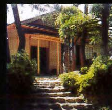
木村茶道美術館 (松雲山荘内)