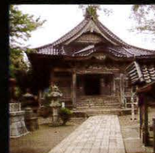
番神堂 (日蓮上人着岸の地)